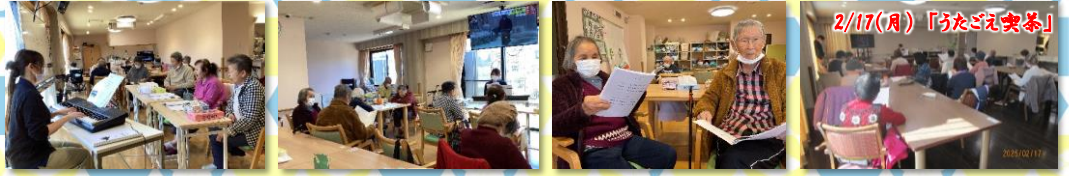
※一部撮影時にマスクをはずしていただいていたので撮影した写真がございます。ご了承ください。

2/5水 音楽教室 M職員が担当し、2/17には近所の方を集めて「うたごえ喫茶」も開催しました。